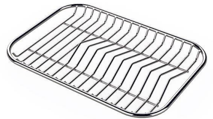
Tellerständer aus Edelstahl 8100 154